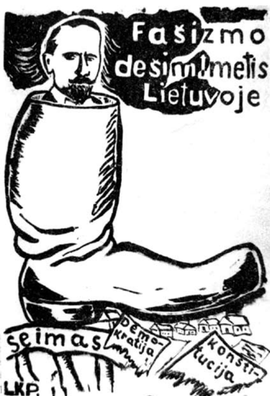
Taip gyvenimą Nepriklausomoje Lietuvoje vaizdavo Lietuvos komunistai.