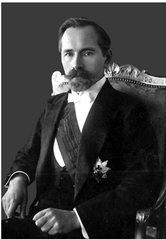
Nepriklausomos Lietuvos prezidentas Antanas Smetona sovietmečiu propagandos buvo vaizduojamas kaip fašistinės valstybės vadovas.

Viskas okupuotoj Lietuvoj buvo pajungta tarnauti sovietinei propagandai. Vienas iš svarbiausių propagandos taikinių buvo ne kas kitas, o Nepriklausoma Lietuvos Respublika. Ideologiškai komunistams reikėjo įrodyti, kad gyvenimas sovietų vadinamoje buržuazinėje Lietuvoje prilygo pragariui, o štai atėjus sovietams klestėte suklestėjo komunistinis rojus. Šiame straipsnyje apžvelgsime, kaip tarybinio laikotarpio buvo pateikiamas gyvenimas Nepriklausomoje Lietuvoje.